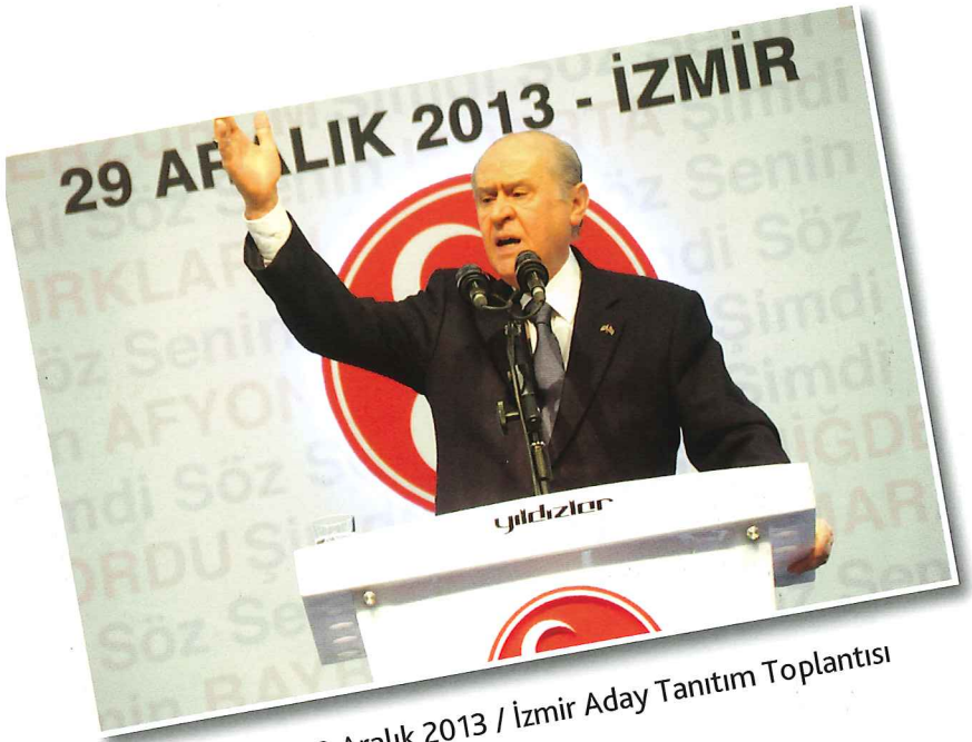
29 Aralık 2013 / İzmir Aday Tanıtım Toplantısı