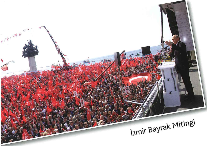
İzmir Bayrak Mitingi