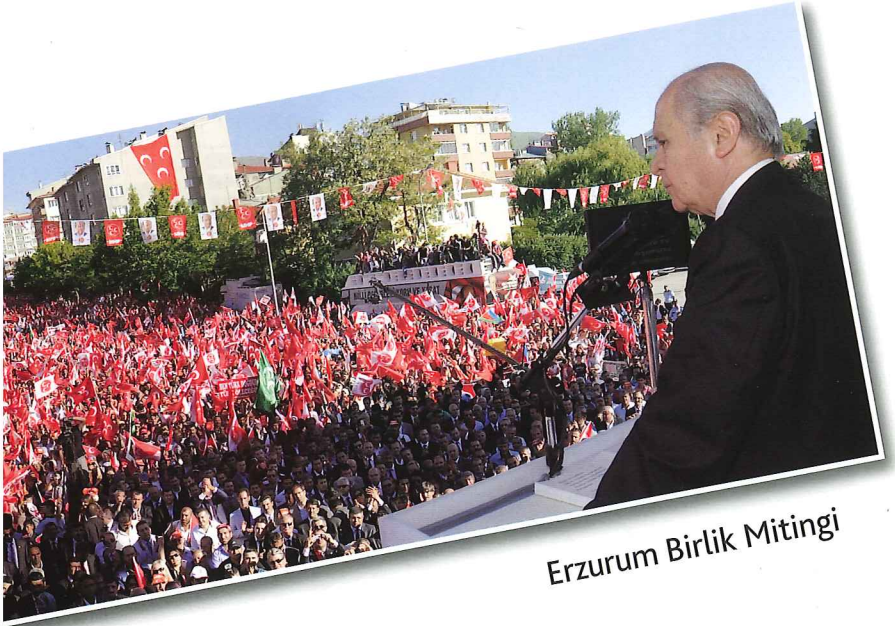
Erzurum Birlik Mitingi