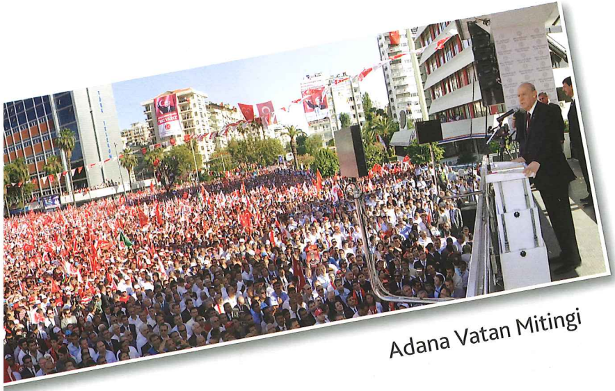
Adana Vatan Mitingi