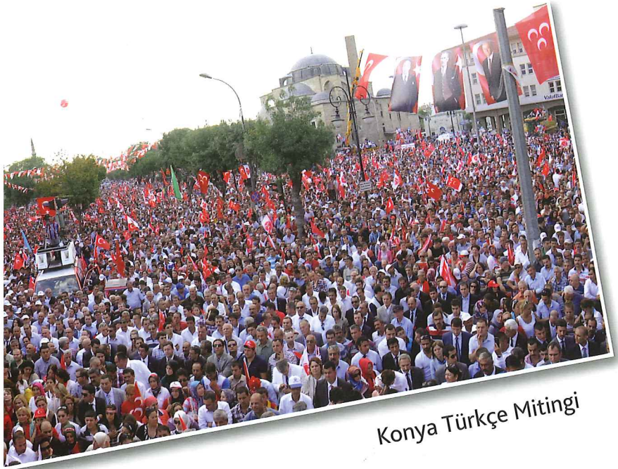
Konya Türkçe Mitingi