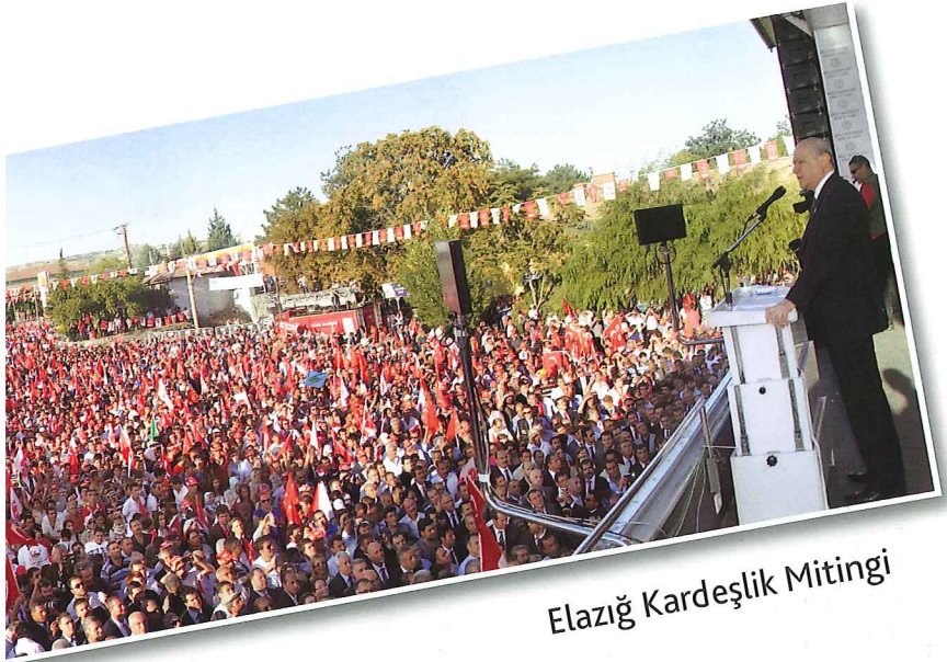
Elazığ Kardeşlik Mitingi