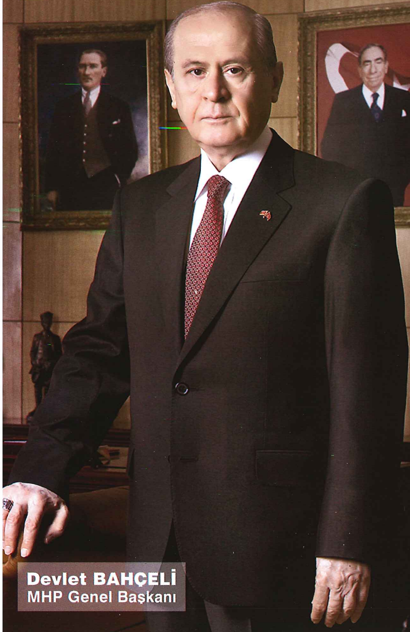
Devlet BAHÇELİ MHP Genel Başkanı