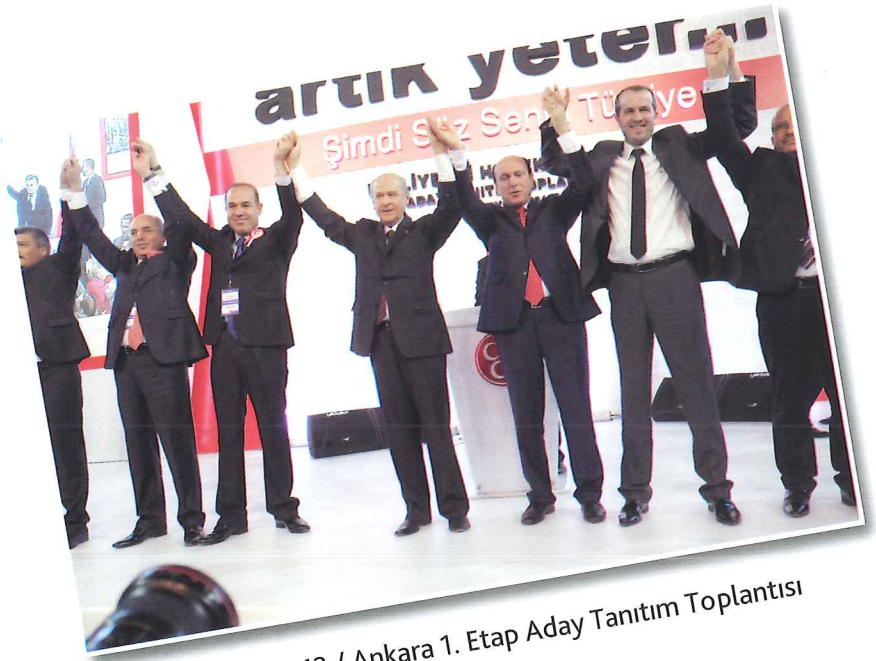
29 Eylül 2013 / Ankara 1. Etap Aday Tanıtım Toplantısı