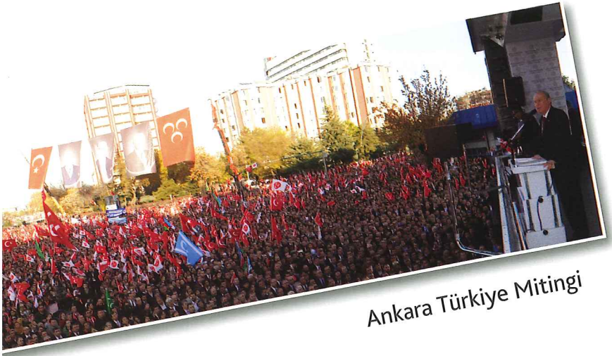
Ankara Türkiye Mitingi