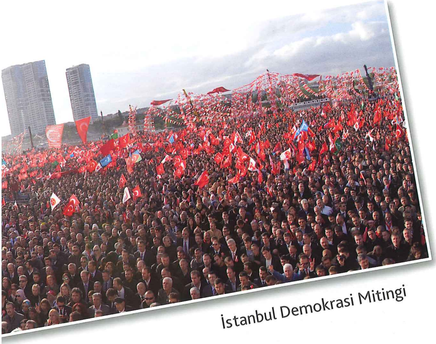
İstanbul Demokrasi Mitingi