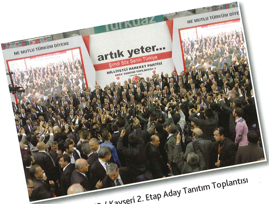
2 Kasım 2013 / Kayseri 2. Etap Aday Tanıtım Toplantısı