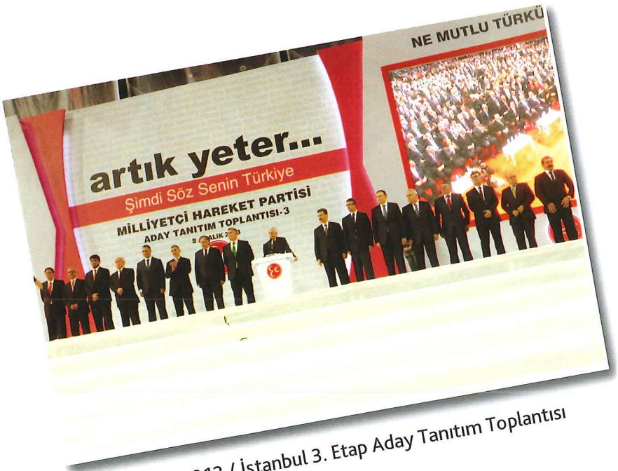
8 Aralık 2013 / İstanbul 3. Etap Aday Tanıtım Toplantısı