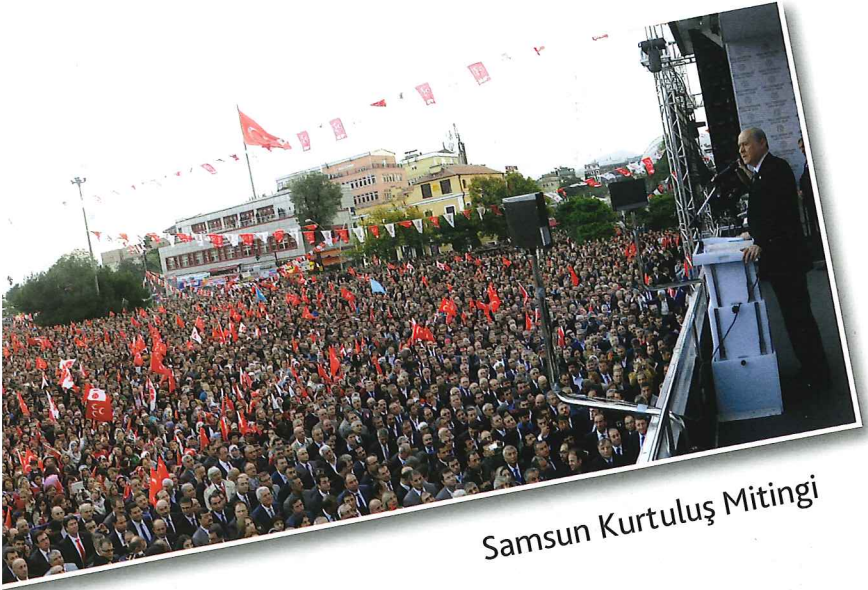
Samsun Kurtuluş Mitingi