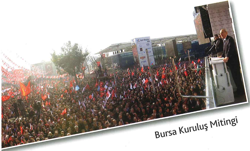
Bursa Kuruluş Mitingi